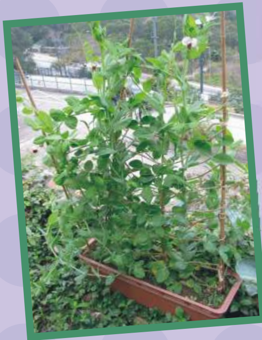
以盆種植的荷蘭豆