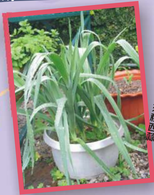
鹽飯煲也可用來種西蒜