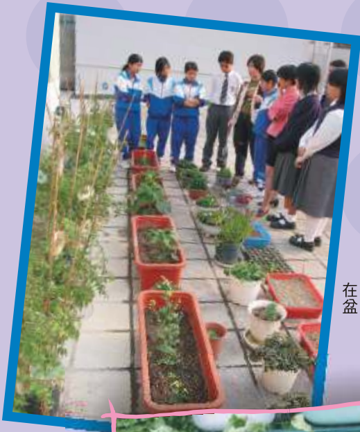
在天台中開設盆栽農圃

利用盆栽堆砌而成農圃，對居於城市而空間或設施不足的園藝者來說，是最理想不過了。盆栽農圃的大小可靈活選擇，又方便遷移。可是，盆栽農圃的產量和可種植的作物種類選擇會較傳統農圃少，並需要較頻密灌溉。