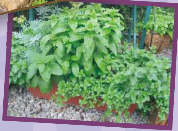
數種香草混種於一盆之內。