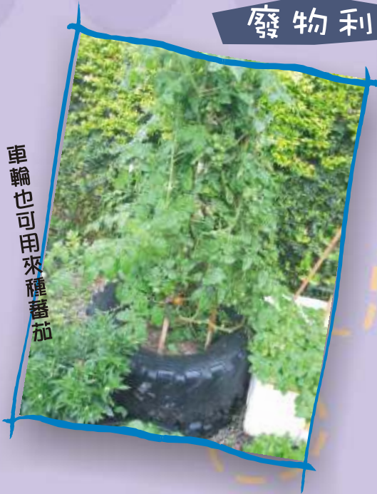
車輪也可用來種蕃茄