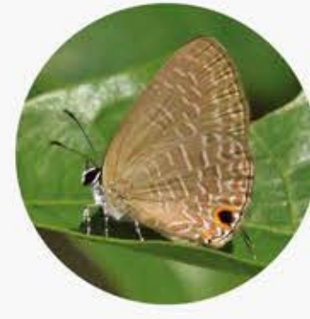
雅灰蝶 Dark Cerulean Jamides bochus ★★★ XS