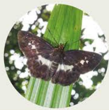
匪夷捷弄蝶 White-banded Flat Geropsis phisara ★★ S