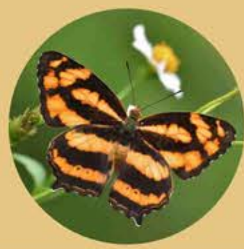
散紋盛蛺蝶 Common Jester Symbrenthia lilaea ★★★ M