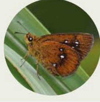
雅弄蝶 Chestnut Bob Iambrix salsala ★★★ S