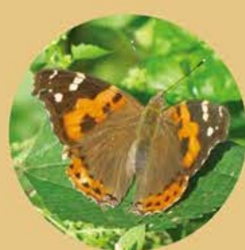
大紅蛺蝶 Indian Red Admiral Danaus indica ★★★ M