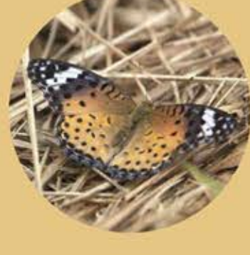
斐豹蛺蝶(雌) Indian Fritillary ♀ Argyreus hyperbius ★★★ L