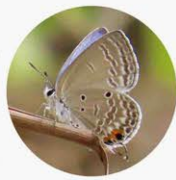
曲紋紫灰蝶 Plains Cupid Chilades pandava ★ S