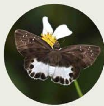
沾邊裙弄蝶 Water Snow Flat Tagiades litigiosus ★★★ S