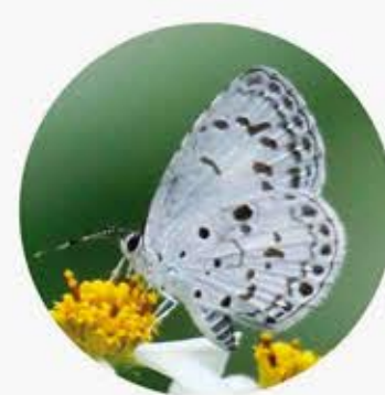
鈕灰蝶 Common Hedge Blue Acyrtopis puspa ★★★ S