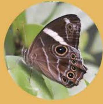
白帶黛眼蝶 Banded Tree Brown Lethe confusa ★★★ M