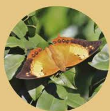
白帶螯蛺蝶 Tawny Rajah Charaxes bernardus ★★★ L