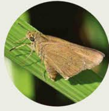
古銅殼弄蝶 Conjoined Swift Pelopidas conjunctus ★★ M