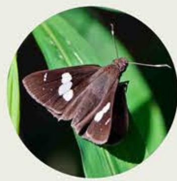
曲紋袖弄蝶 Restricted Demon Notocrypta curvifascia ★★ S