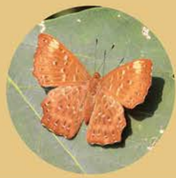
波蜆蝶 Punchinello Zemeros flegyas ★★★ S