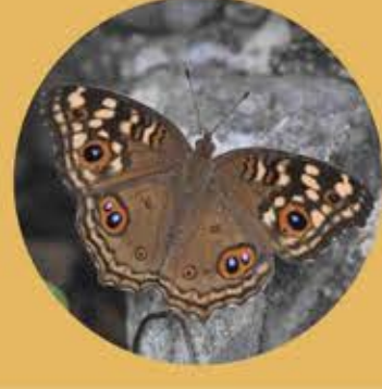
蛇眼蝶 Lemon Pansy Junonia lemonias ★★ M