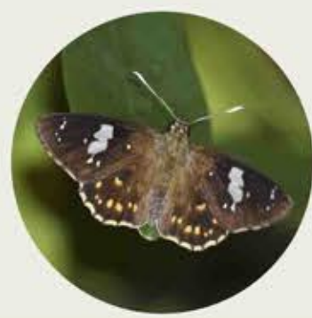
白觸星弄蝶 Common Spotted Flat Celaenorrhinus leucocera ★★★ M