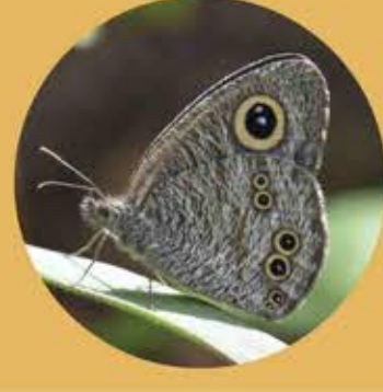
鑾眼蝶 Common Five-ring Ypthima baldus ★★★ S