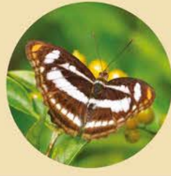
相思帶蛺蝶 Colour Sergeant Athyma nefte ★★★ M