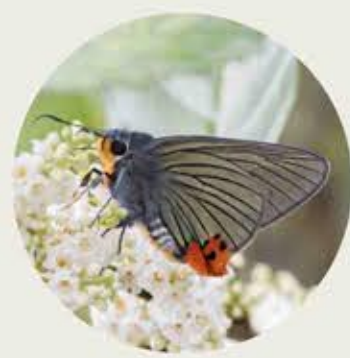
綠弄蝶 Indian Awl King Choaspes benjaminii ★ M