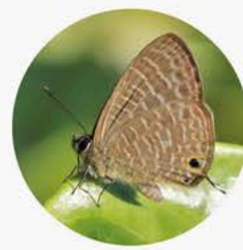
百娜灰蝶 Rounded 6-line Blue Nacaduba berenice ★ S