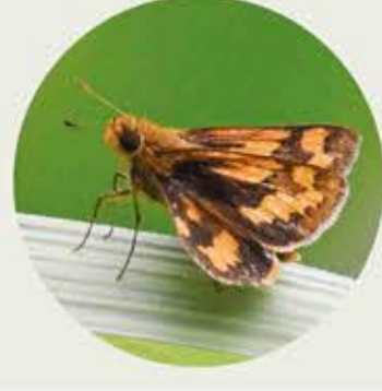
孔子黃室弄蝶 Chinese Dart Potanthus confucius ★ XS