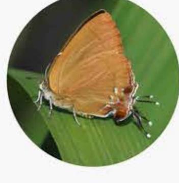
萊灰蝶 Chocolate Royal Remelana jangala ★★★ S