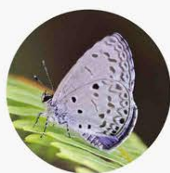
薰衣草琉璃灰蝶 Plain Hedge Blue Acyrtopis puspa ★ S