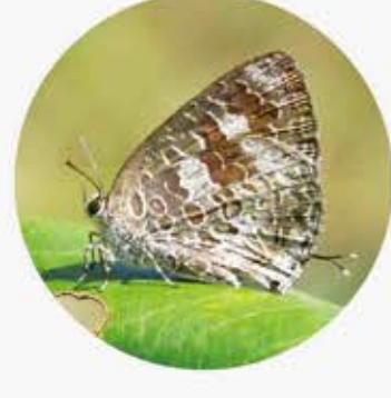
緬甸嬌灰蝶 Burmese Bush Blue Arhopala birmana ★ S