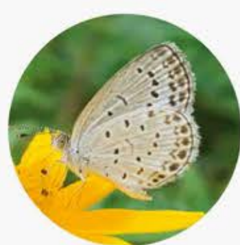
許縷灰蝶 Pale Grass Blue Zizeeria maha ★★★ XS