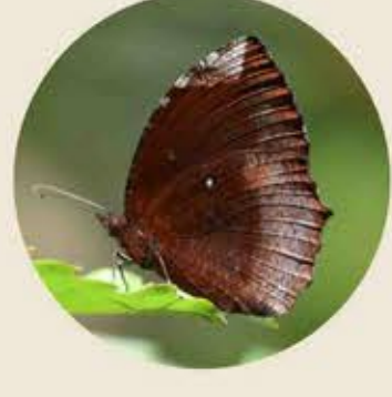
翠袖鏢眼蝶 Common Palmfly Elymnias hypermnestra ★★★ M