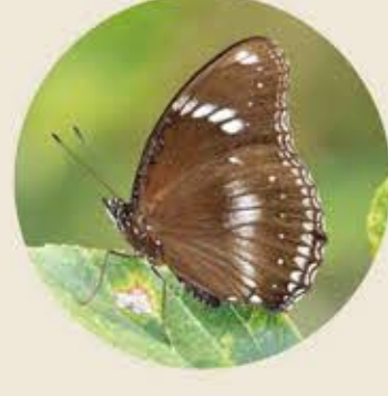
幻紫斑蛺蝶 Great Egg-fly Hypolimnas bolina ★★★ L-XL