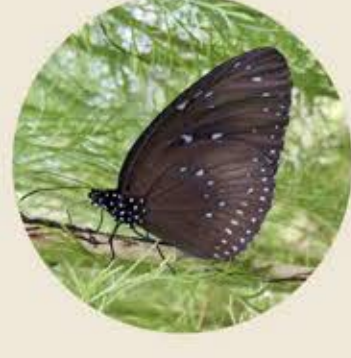
藍點紫斑蝶 Blue-Spotted Crow Euploea midamus ★★ XL