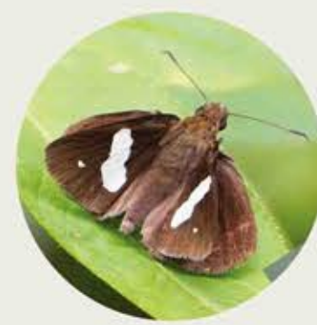
窄紋袖弄蝶 Banded Demon Notocrypta paralyos ★ S