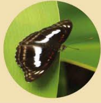
新月帶蛺蝶 Staff Sergeant Athyma selenophora ★★ M