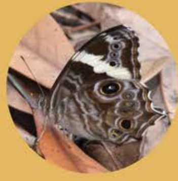
波紋黛眼蝶(雌) Common Tree Brown ♀ Lethe rohria ★★ M