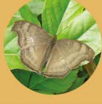
鈎翅眼蝶 Chocolate Pansy Junonia iphita ★★★ M