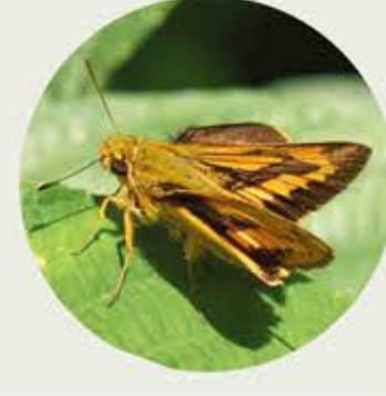
黃紋長標弄蝶 Dark Palm Dart Telicota ohara ★★ S