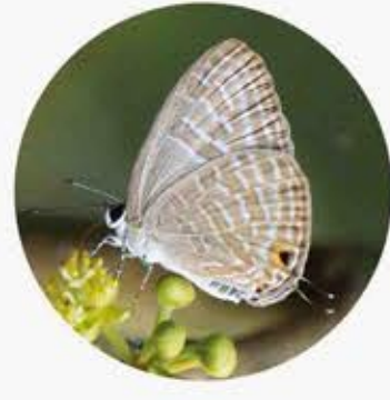
素雅灰蝶 Metallic Cerulean Jamides alecto ★★★ S