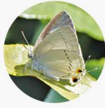
珀灰蝶 White Royal Pratapa deva ★ S