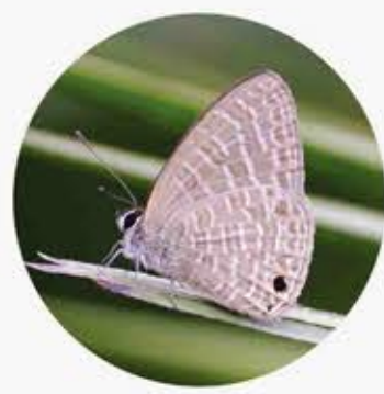
古樓娜灰蝶 Transparent 6-line Blue Nacaduba kurava ★★★ S