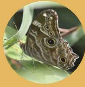
波紋黛眼蝶(雄) Common Tree Brown ♂ Lethe rohria ★★ M