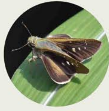
袖弄蝶 Formosan Swift Borbo cinnara ★★ S