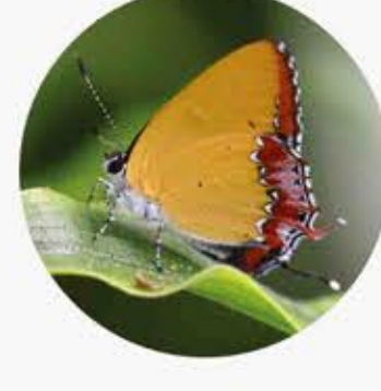
彩灰蝶 Purple Sapphire Heliophorus epicles ★★★ S