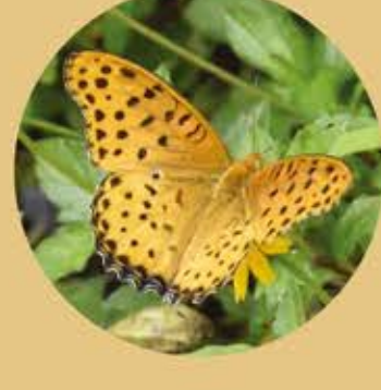
斐豹蛺蝶(雄) Indian Fritillary ♂ Argyreus hyperbius ★★★ L