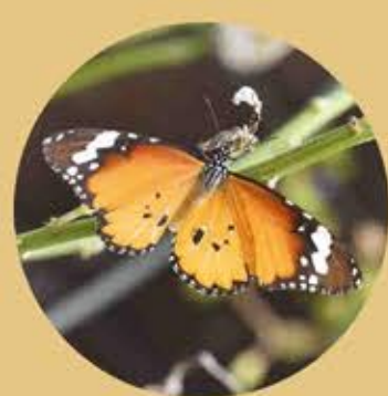
金斑蝶 Plain Tiger Danaus chrysippus ★★ L