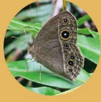
平頂眉眼蝶 South China Bush Brown Mycalesis mucianus ★★★ M