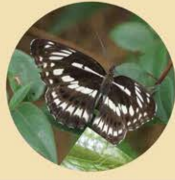
殘鏢線蛺蝶 Five-dot Sergeant Limenitis sulphita ★★ L