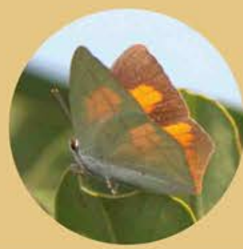
尖翅銀灰蝶 Toothed Sunbeam Curetis acuta ★★★ S