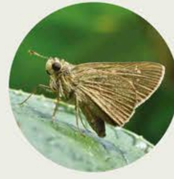
黃紋孔弄蝶 Contiguous Swift Polytremis lubricans ★★★ S