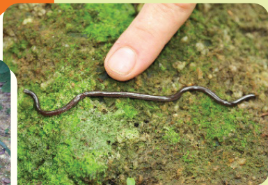
鉤盲蛇 ( Ramphotyphlops braminus )