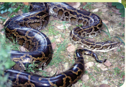
緬甸蟒蛇 ( Python bivittatus )

本港最大的蛇是緬甸蟒蛇(平均長3.7米)，而最小的是鉤盲蛇(平均長10 - 15厘米)。