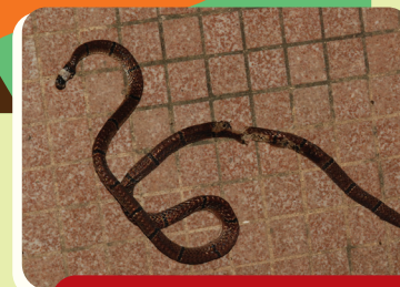
珊瑚蛇誤闖民居後被殺