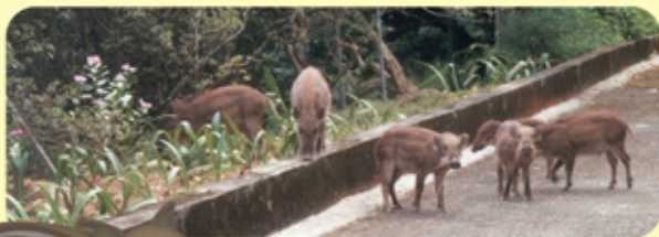
▲ 身上長有條紋的小野豬