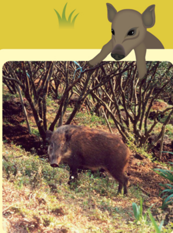
▲ 本地成年野豬可重達200公斤

在正常情況下，野豬與其他野生動物一樣，不會對人類構成危險，不過，遇上牠們時也須保持警覺。野豬十分羞怯，在遇見人或聽到人聲時，通常都會馬上逃跑；但假如被迫至走投無路或受到襲擊，則會嘗試作出自衛。