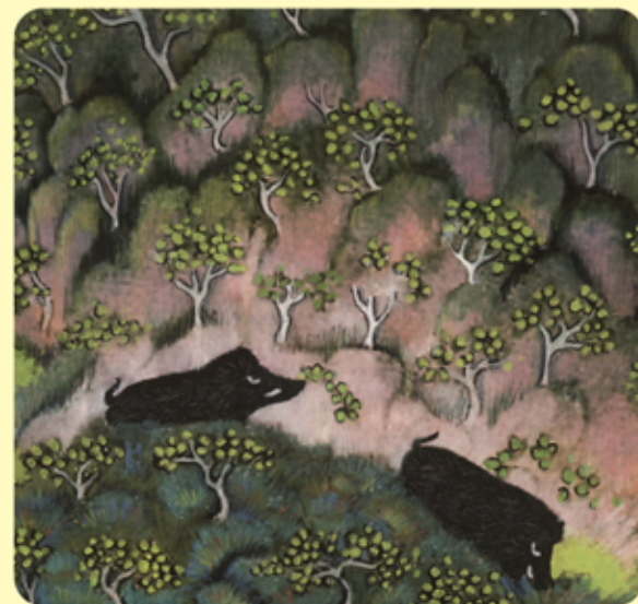
▲ 在中國文化中，野豬象徵「樹林的財產」

野豬能為林地生態帶來極大益處。牠們在表土翻尋食物時會挖鬆土壤及使之通氣，有助促進植物多樣性；此外，當植物的種子依附在其皮毛上，又或被牠們吃掉及排出，便得以散播到其他地方，藉以繁衍。野豬是我們寶貴的自然遺產。